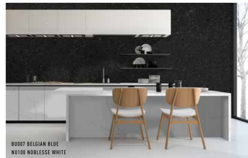
BU007 BELGIAN BLUE NU100 NOBLESSE WHITE